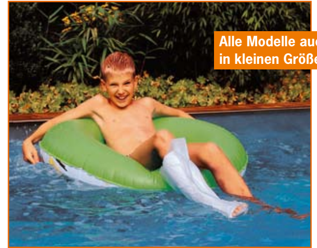
Alle Modelle auch in kleinen Größen.

AquaProtect schützt Arm- und Beinverbände nicht nur beim Duschen und Baden wirkungsvoll vor Wasser, sondern auch im Schwimmbad und beim Wassersport.