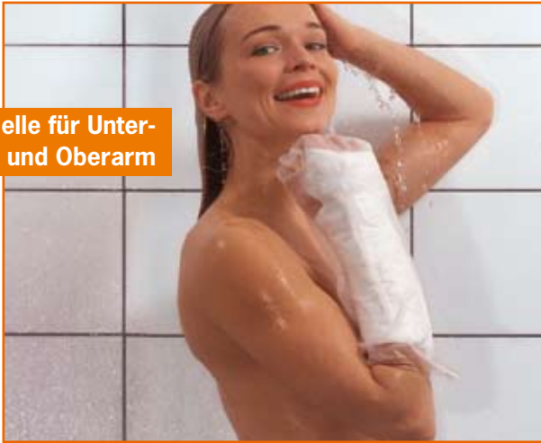
Modelle für Unter- und Oberarm

AquaProtect macht das Leben mit einem Verband einfacher.