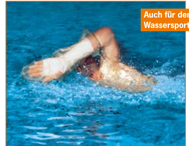
Auch für den Wassersport

Ob beim Schwimmen oder Tauchen – AquaProtect hält dicht.