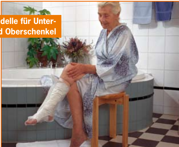
Modelle für Unter- und Oberschenkel

Eine erfrischende Dusche oder gar ein entspannendes Vollbad – das geht jetzt ganz mühelos. Auch der Abwasch oder feucht Aufwischen sind kein Problem: Sie streifen AquaProtect über den Verband und haben ihn 100 % wasserdicht geschützt.